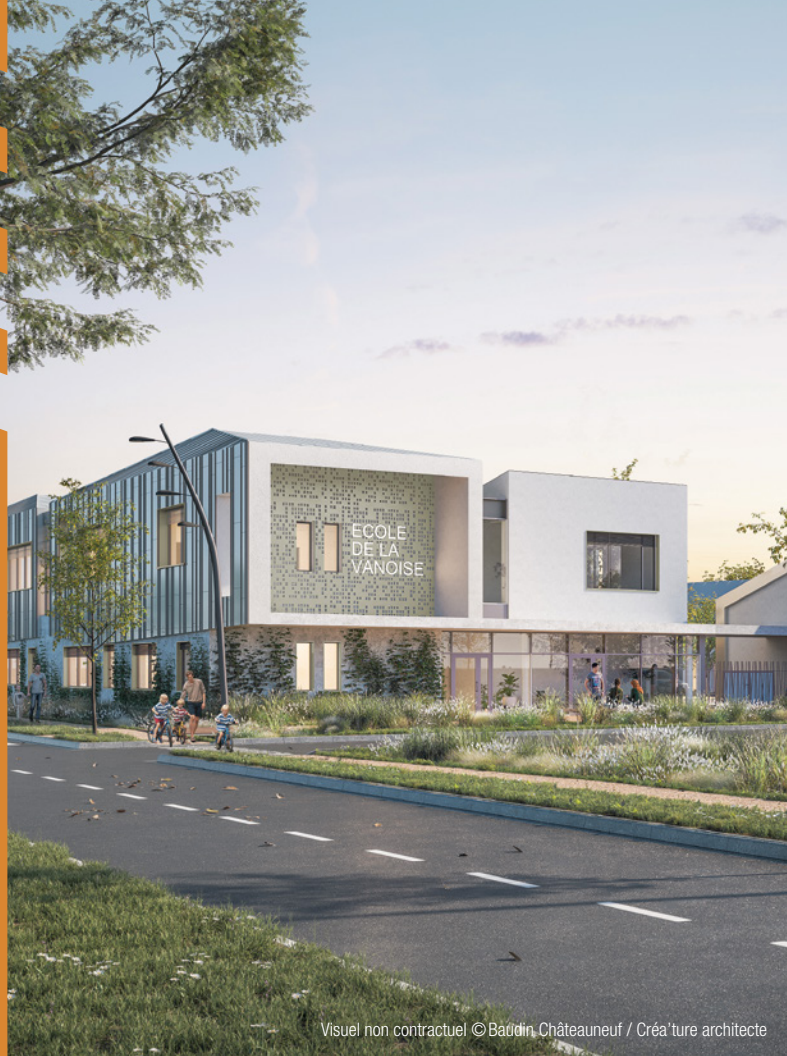
Visuel non contractuel © Baudin Châteauneuf / Créature architecte