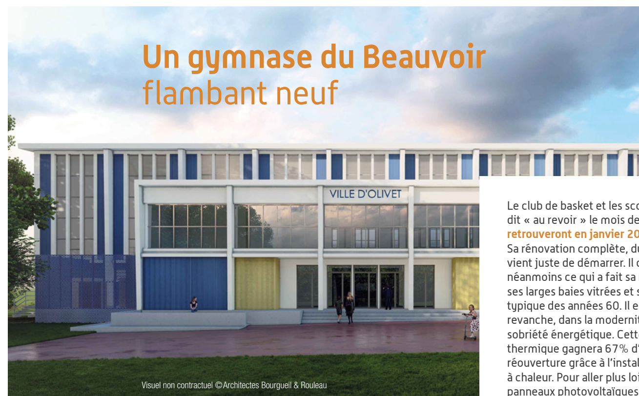
Visuel non contractuel © Architectes Bourguell & Rouleau

La Ville travaille à l'ouverture d'un atelier pour petits bricoleurs . Le concept va être testé dans les prochains mois au château du Poutyl en expérimentant des activités pour épancher leur soif d'apprendre et créer de leurs mains. Dans ce Lab'O, ils pourront bricoler, coder, réparer, construire, faire des expériences en s'amusant, avec des Géo Trouvetou, passionnés et pédagogues.